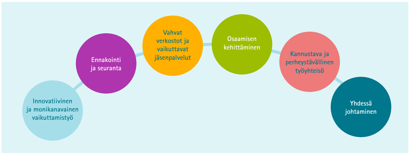
Kuvio 4: Tiekartta strategiakaudelle

T ÄSSÄ LUVUSSA KUVATAAN koko organisaatiota koskevat sisäiset tavoitteet, joiden avulla Lastensuojelun Keskusliitto pystyy vahvistamaan vaikuttavuuttaan ja rakentamaan organisaatiolle aiempaa kestävämmän toiminnallisen pohjan. Tiekarttaa tullaan tarvittaessa täsmentämään strategian puolivälitarkastelussa.