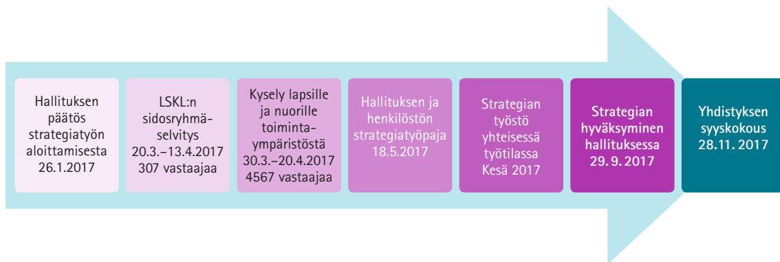
Kuva 1: Strategian laatimisen aikajana ja tausta-aineistot

Strategia on kirjoitettu ajanjaksolle 2018–2021. Strategia kuitenkin elää ajassa ja sen toteutumista seurataan ja konkretisoidaan toimintasuunnitelmissa. Strategiakauden puolivälissä strategian toteumista arvioidaan suhteessa toimintaympäristössä ja laajemmin yhteiskunnassa tapahtuneisiin muutoksiin. Tämän puolivälitarkastelun pohjalta määritellään mahdollisesti tarvittavat painopisteiden muutokset.