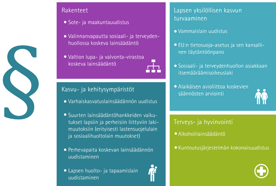
Kuvio 1: Seurattavat lakihankkeet vuosina 2018–2019