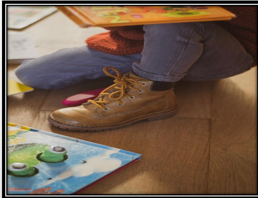
Ei enää hiljaisuutta