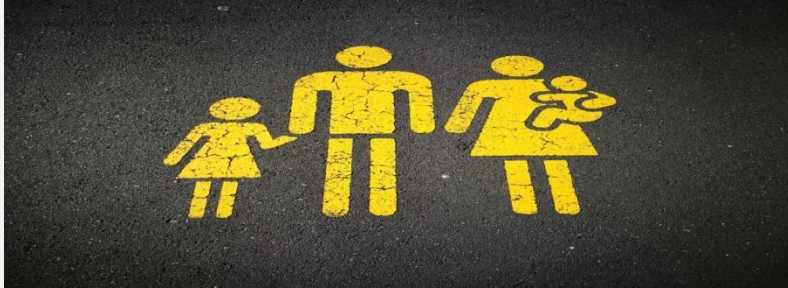
Lapsen ja perheen tuki ja hoito