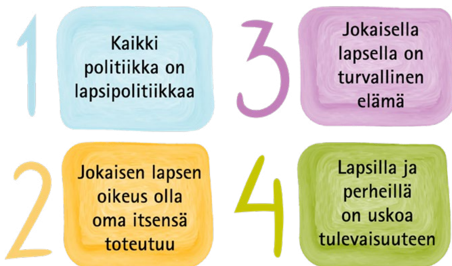
Kuva 2. Strategiset tavoitteet vuosina 2022–2025.

Lastensuojelun Keskusliitto on strategiassaan vuosille 2022–2025 määritellyt neljä strategista tavoitetta. Kaksivuotisissa toimintasuunnitelmissa (2022–2023 ja 2024–2025) tarkennetaan ja seurataan näiden strategisten tavoitteiden toteuttamista konkreettisilla toimilla/hankkeilla. Tavoitteet voivat painottua eri tavoin eri toimintasuunnitelmakausilla.